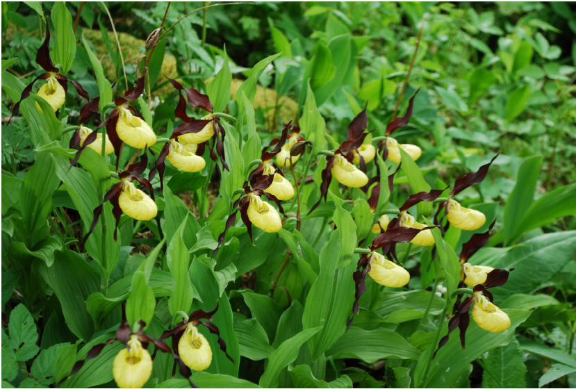
Guckusko i Björskogs näs