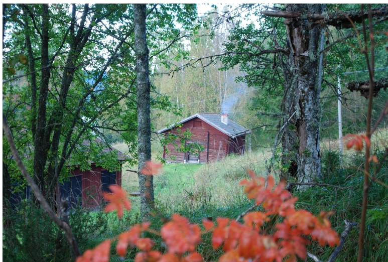
Rökstugan vid Rattsjögården